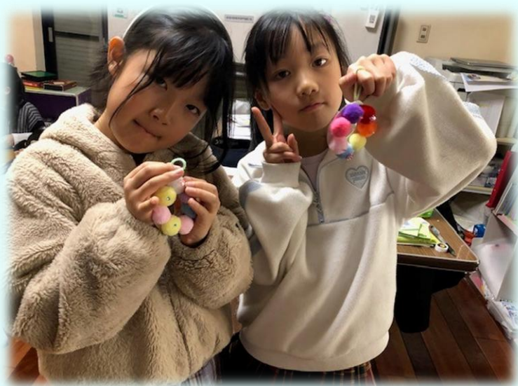
アート クリスマスリース