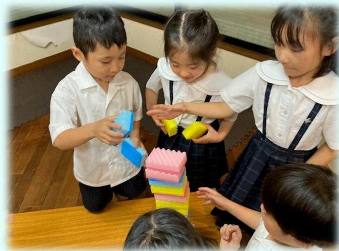
レクリエーション 協力！スポンジ積み